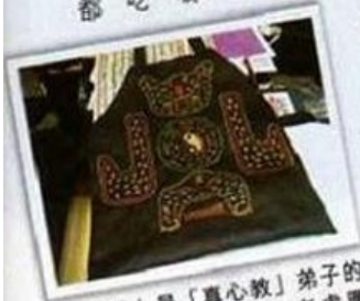
的圖 子虎內 弟老兒 是正符咒 「真心教」 其正面寫 是「乾坤 法寶」則 背面則全 寫滿符咒 故有破砂 袋法寶等 法器。